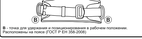
Рис. 2. Типы крепежных точек

В - точка для удержания и позиционирования в рабочем положении. Расположены на поясе (ГОСТ Р ЕН 358-2008)